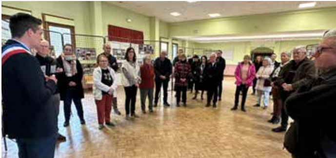
Il y a 80 ans... La Libération : Une exposition photographique organisée en partenariat avec Les Amis du Ban d'Étival, a permis de se remémorer cette tragique période. Avec la collection photographique de Marius Coutret.