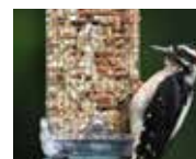
LE PIC ÉPEICHE

Quelquefois, le pic vert, le pic épeiche ou le geai s'invitent dans les mangeoires. Les tarins, les verdiers et les mésanges à longue queue arrivent toujours en groupes de quelques individus à plusieurs dizaines.