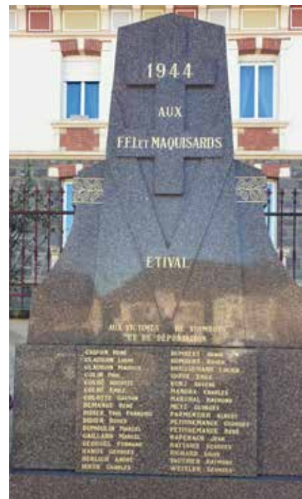
Restauration du monument à l'occasion des 80 ans de la Déportation.