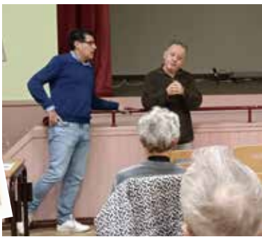
Organisée par l'association culturelle.