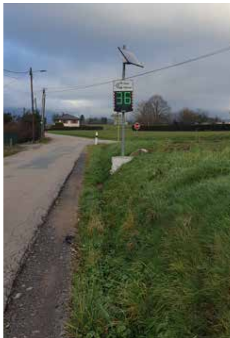
Déplacement du radar pédagogique rue du Vivier.