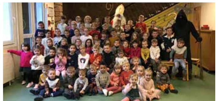
Organisée par le comité des fêtes.