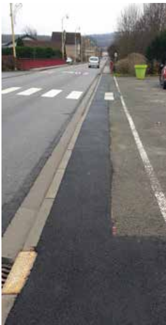
Réfection d'avaloirs et renforcement d'accotements dans la commune.