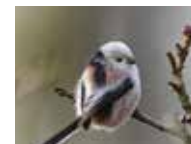
LA MÉSANGE À LONGUE QUEUE