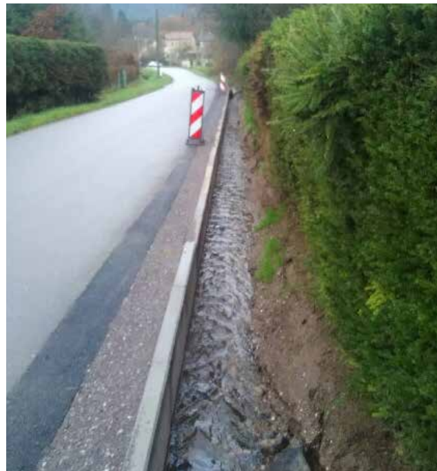
Réfection de la berge et stabilisation de la chaussée.