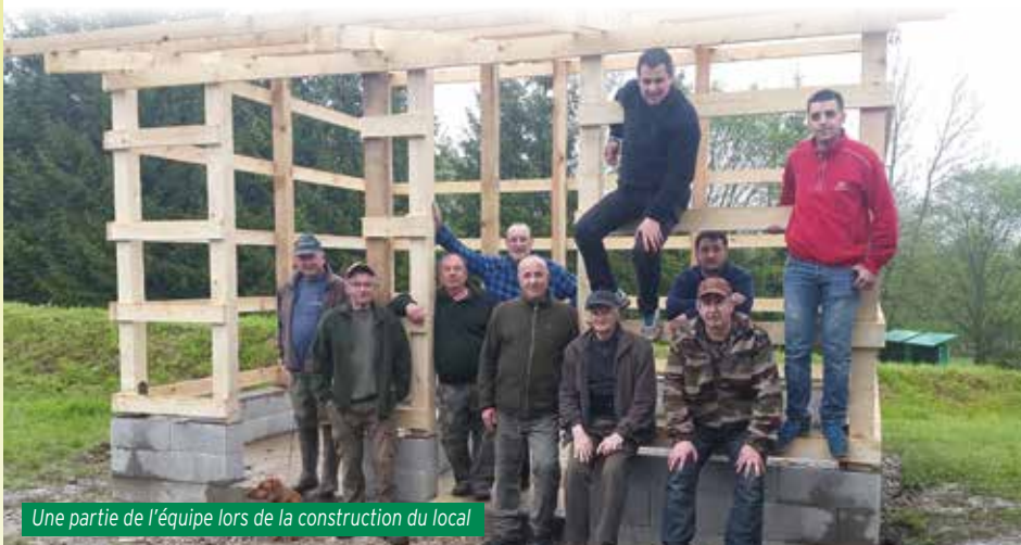
Une partie de l'équipe lors de la construction du local

J'aimerais aussi emmener avec moi des "anti-chasse", non pas pour les convaincre mais juste pour leur montrer comment se passe une journée de chasse.