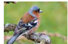
LE PINSON DU NORD