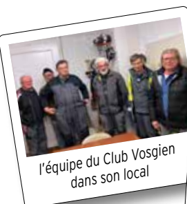
L'équipe du Club Vosgien dans son local

Le Club vosgien a été fondé en Allemagne, ce qui explique la rigueur de son organisation. Les membres peuvent être marcheurs, baliseurs et guides.