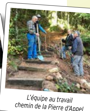
L'équipe au travail chemin de la Pierre d'Appel

Les baliseurs participent à une formation d'une journée avec la fédération pour la signalétique avant d'intégrer l'équipe et ils sont ensuite formés sur place.