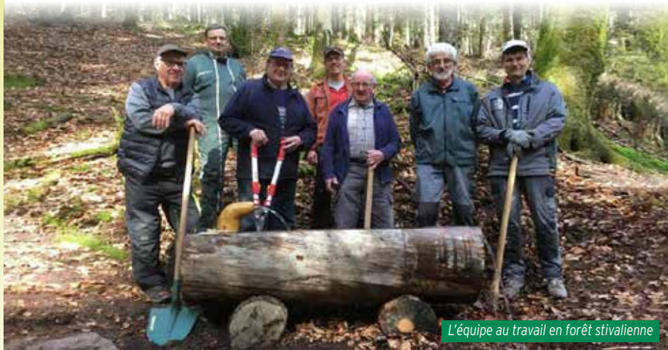
L'équipe au travail en forêt stivalienne

Notre problème, c'est de trouver des personnes jeunes pour renforcer les équipes, mais je pense que c'est le souci de beaucoup d'associations à l'heure actuelle.