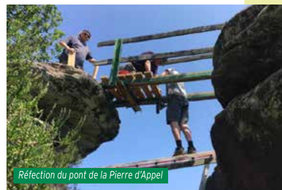
Réfection du pont de la Pierre d'Appel

Les guides peuvent, à leur demande, bénéficier d'une formation d'une semaine conduite par la fédération pour prévoir et animer les randonnées.