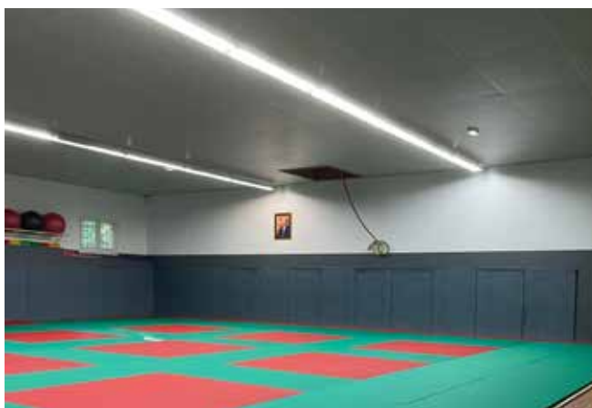
Rénovation de la salle de judo, sol et murs.