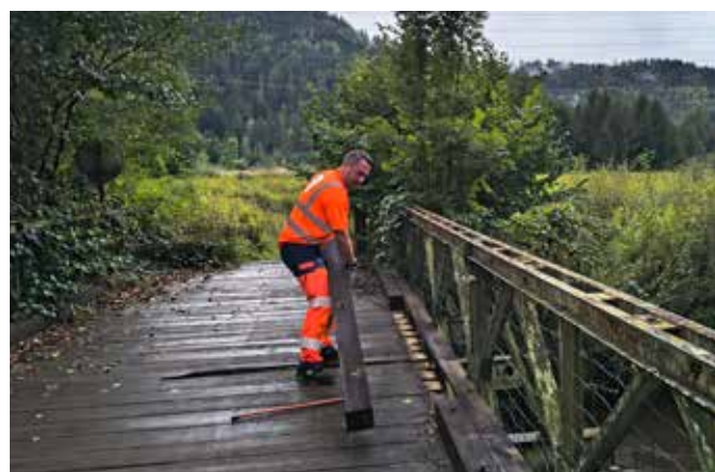
Remise en état du pont Bailey.