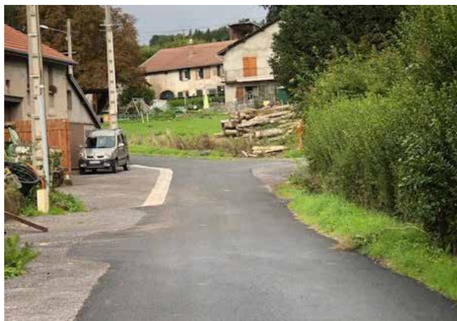
Réfection de la chaussée à Deyfosse.