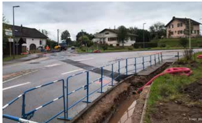
Enfouissement de la ligne aérienne haute tension entre le Ménil et la Rappe.