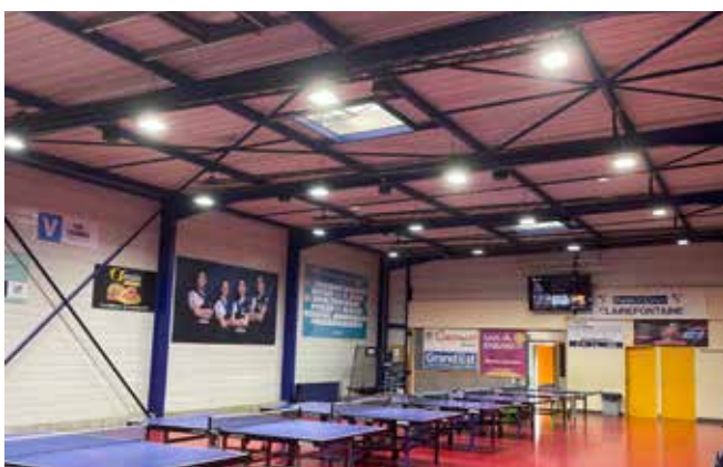
Changement de l'éclairage salle de tennis de table.