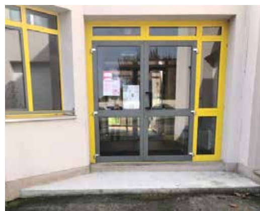
Mise aux normes de l'accès à la salle à manger jouxtant la salle des fêtes.