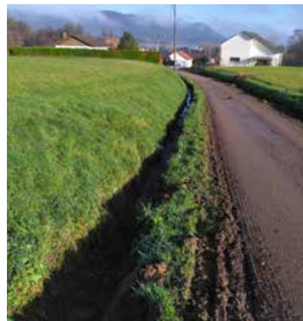
Réalisation d'un curage des fossés sur les secteurs du Ménil.