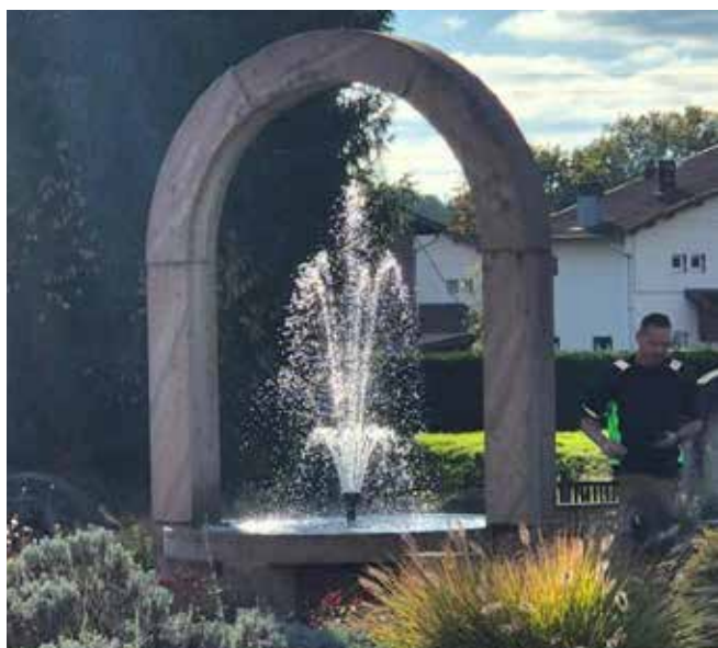
Remise en fonctionnement de la fontaine.

Réhabilitation en cours d'un appartement dans l'immeuble situé en face de l'ancienne école de Pajailles, pour offrir un hébergement d'urgence aux habitants en cas de sinistre.