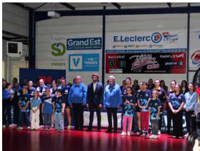
En ligue des champions, l'ASRTT recevait Carthagène (1-3).