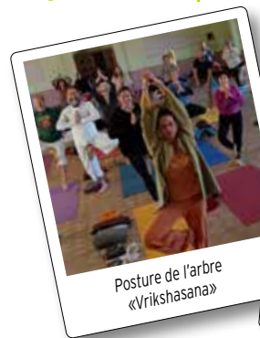
Posture de l'arbre «Vrikshasana»

J'y consacre deux heures et demie tous les matins. C'est un engagement quotidien et absolu. Je crois à une autre vie, et c'est cette conviction profonde qui me donne une force extraordinaire, aussi bien physique que mentale.