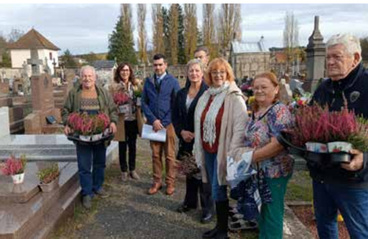
Dépôt de bruyères sur les tombes des soldats morts au combat à Étival de 1870 à 1944, des maires et adjoints.