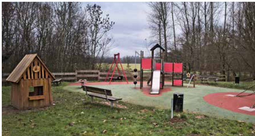
Installation d'une maisonnette en bois à proximité de l'aire de jeux, située dans le parc de la résidence de la Valdange.