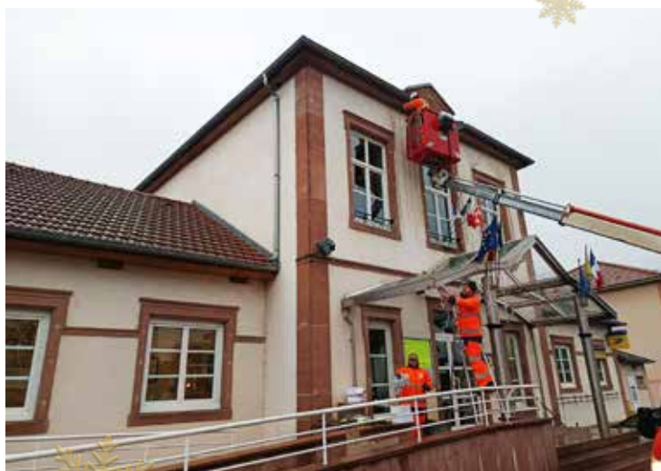
Installation des décorations de Noël.