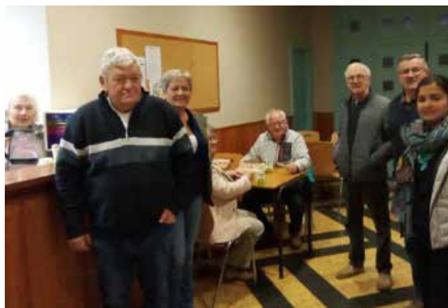
Avec la participation du CCAS.