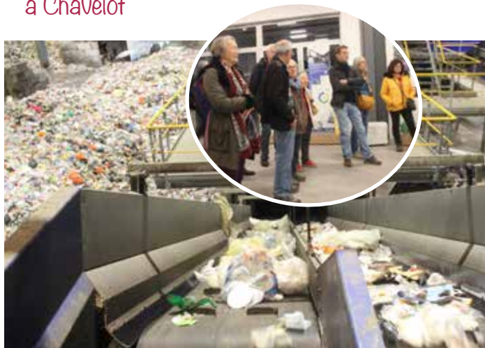
Organisée par la commission environnement.